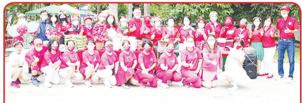
FOTO BERSAMA: Kelompok senam New Rainbow Group BCA dan Kelompok Senam Tarik Urat (STU) Lapangan Merdeka berfoto bersama.