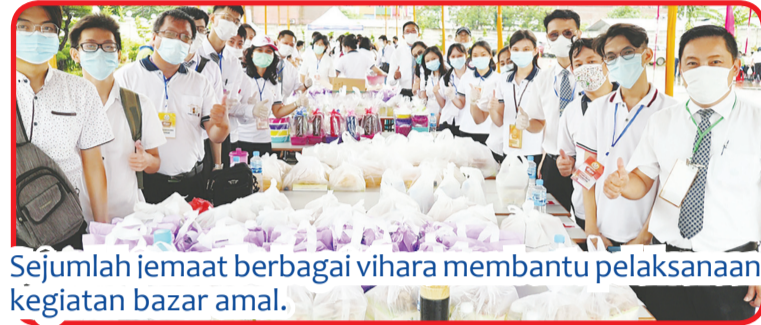
Sejumlah jemaat berbagai vihara membantu pelaksanaan kegiatan bazaar amal.

Menurut rencana acara semacam ini akan kembali diselenggarakan di masa mendatang. • idn/din