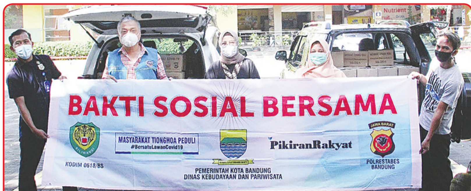
SERAHKAN PAKET; Masyarakat Tionghoa Peduli Bandung menyerahkan paket cinta kasih kepada Dinas Kesehatan Bandung.