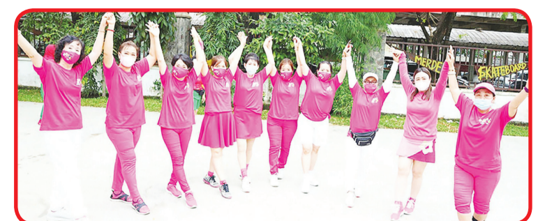
Kelompok senam New Rainbow Group BCA menampilkan senam.