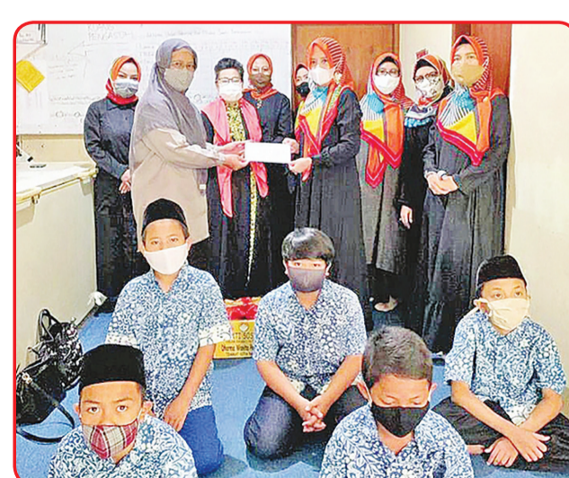
SERAHKAN PAKET: Perwakilan Ormas Wanita Bandung menyerahkan paket sembako kepada pimpinan panti asuhan.