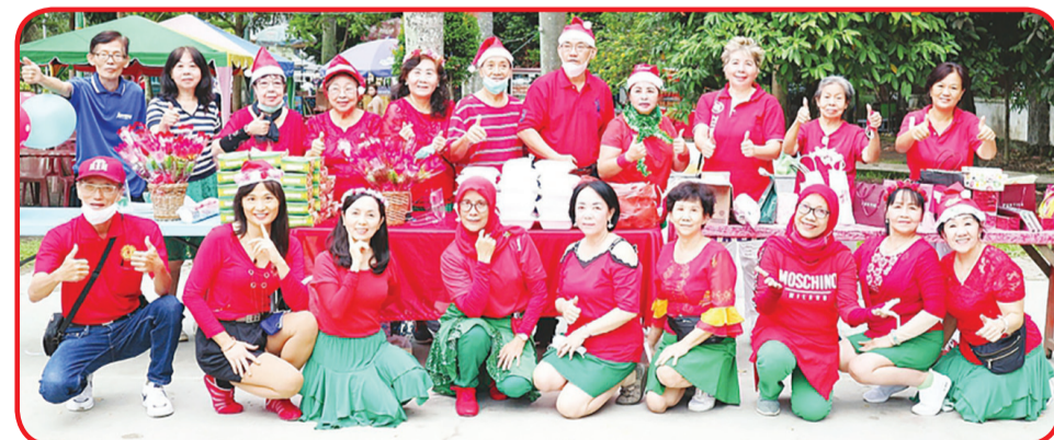
FOTO BERSAMA: Kelompok Senam Tarik Urat (STU) Lapangan Merdeka berfoto bersama.

Setelah pengundian hadiah, semua yang hadir bersama-sama menikmati makan pagi. Selanjutnya semua yang hadir saling mengucapkan Merry Christmas & Happy New Year. idn/din