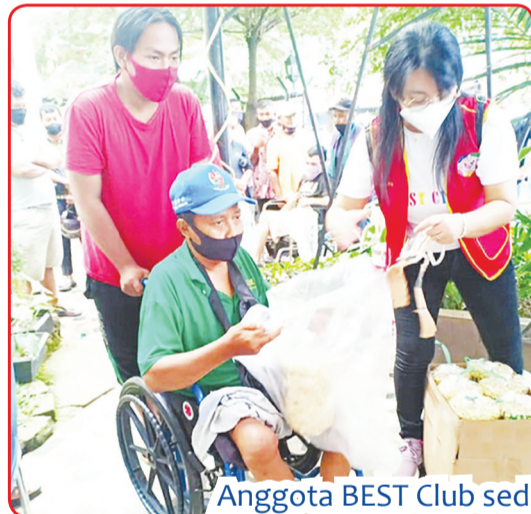
Anggota BEST Club sedang menyerahkan bingkisan Natal kepada penyandang disabilitas.