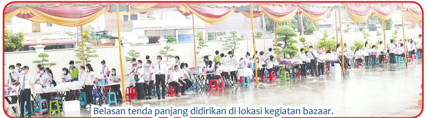
Belasan tenda panjang didirikan di lokasi kegiatan bazaar.